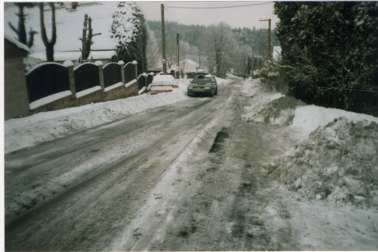
špatné parkování u č.p. 93 p. LISÝ JAHN